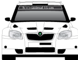
FRONTSCHIBE LT. ARTIKEL 18.7.4 national